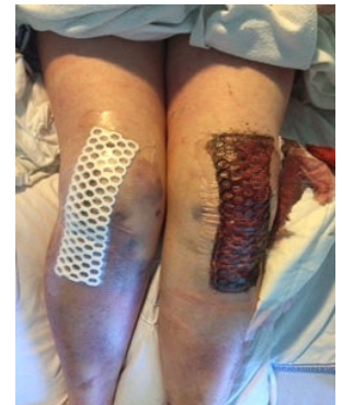
Propre vs 100% souillé